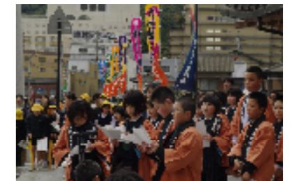
お練り 子ども木戸芸者